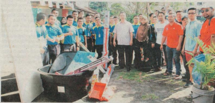
Mereka yang menjayakan program Johor Future 2016 bergambar bersama.

"Namun, sekiranya hanya sakit sedikit-sedikit dia tetap